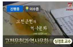
고전문헌과 역사문화 II