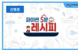
파이썬 5분 레시피