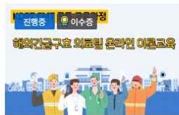
해외진출구호 의료팀 교육